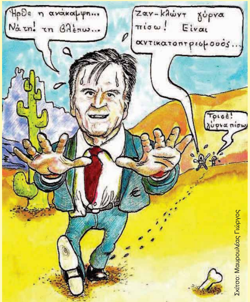
Σκίτσος: Μαουρουλέας Γιώργος

Το ερώτημα αυτό ταλανίζει όλα τα οικονομικά επιτελεία όλων των χωρών του κόσμου, με εξαίρεση ίσως κάποιες που οι κάτοικοί τους δεν έχουν οικονομικές δραστηριότητες και είναι οι ξεχα-