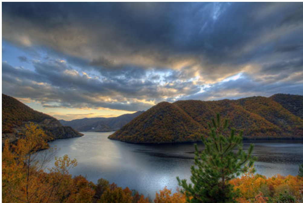
Τα φθινοπωρινά χρώματα του Νέστου