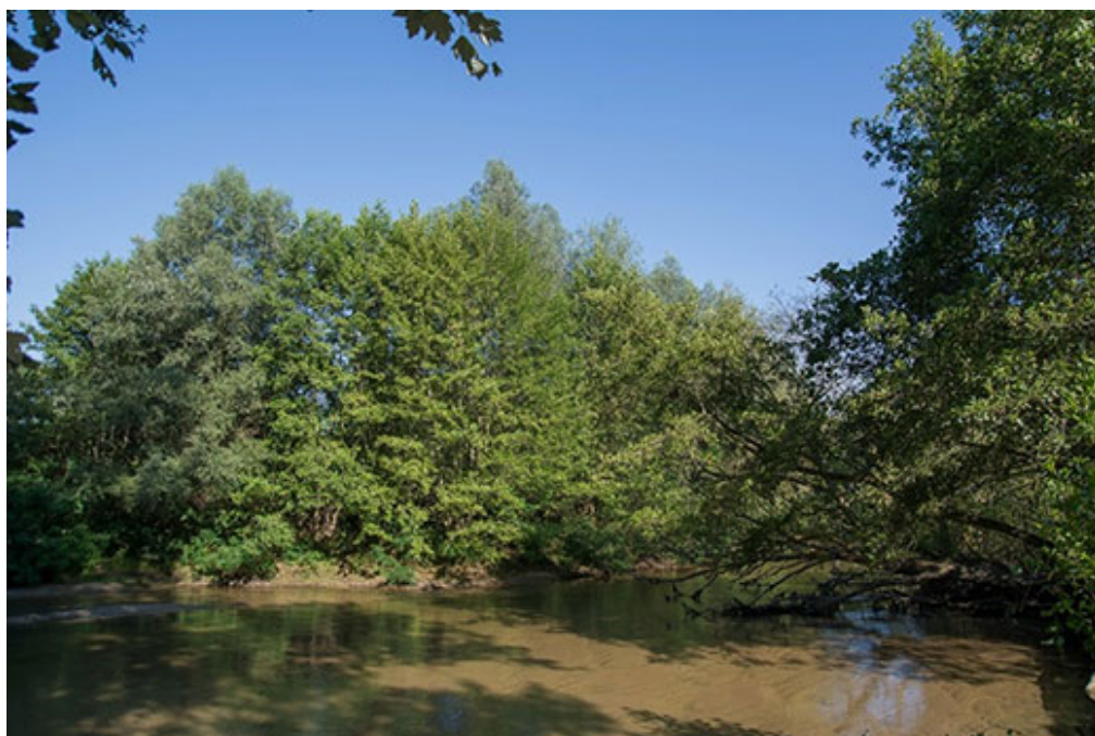
Το παραποτάμιο Μέγα Δάσος

Τοξότες, ξεχύνεται στην πεδιάδα κατ' ευθείαν στη θάλασσα, χωρίς μαιανδρισμούς, απέναντι στη θάσο. Δεξιά και αριστερά των όχθων του από τους Τοξότες έως τη θάλασσα σε μήκος 27 και πλάτος 3-7 χιλιόμετρα, ζωογονούσε με τα νερά του το ωραιότερο και πολυτιμότερο υδροχαρές δάσος της Ευρώπης, το Κοτζά Ορμάν , που στην τουρκική γλώσσα σημαίνει «Μέγα Δάσος» .