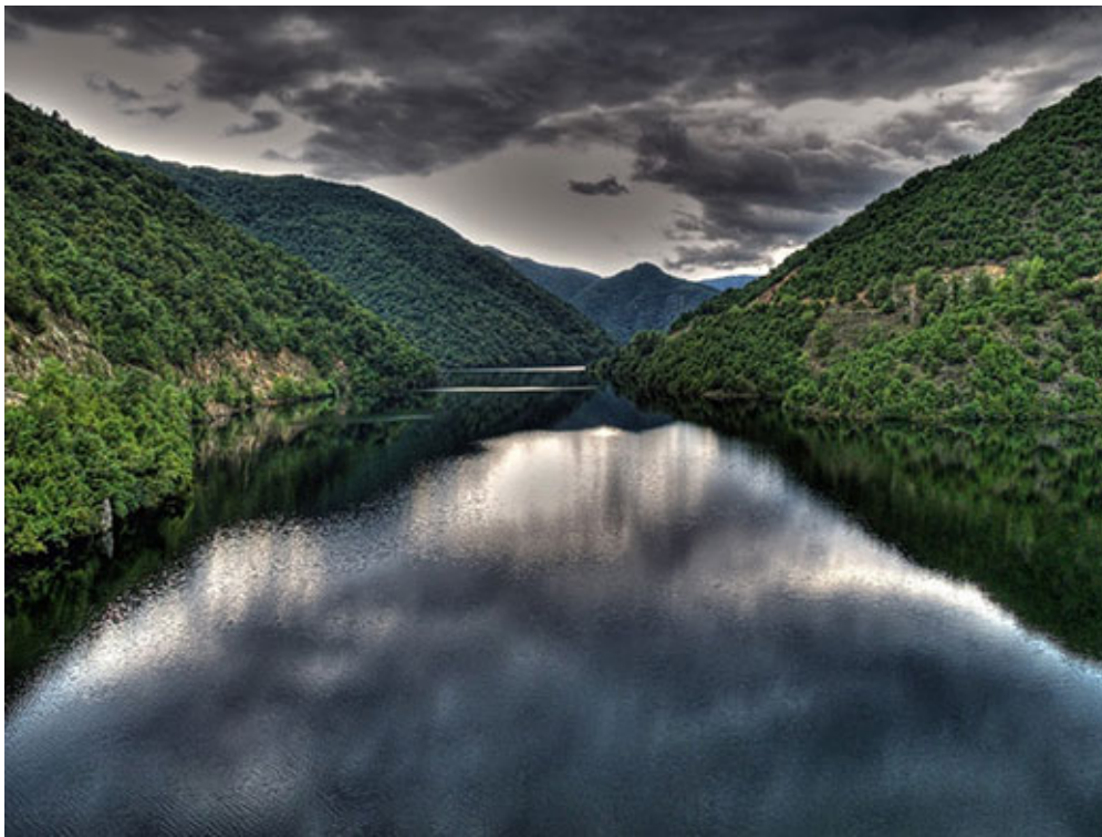
Ο Νέστος ποταμός