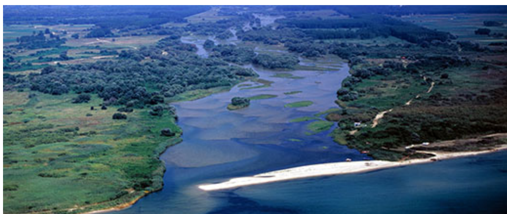
Οι εκβολές του Νέστου