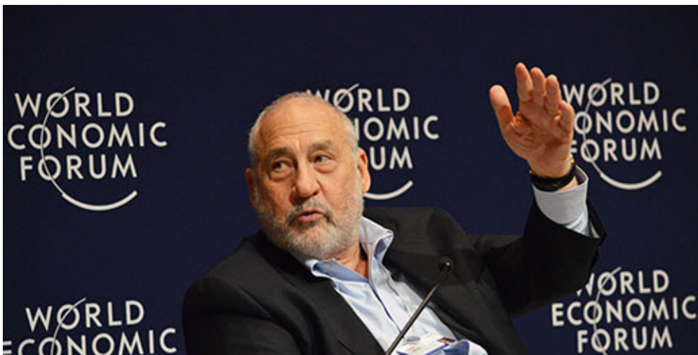
Ο Τζόζεφ Στίγκλιτς

Η φορολόγηση του πλούτου είναι τόσο σκανδαλωδώς χαμηλή, που σοκάρει ακόμη και ανθρώπους που ανήκουν στη βαθιά πλουτοκρατία: «... μερικοί από τους γνωστότερους πλουτοκράτες, με κυριότερο παράδειγμα τον Γουόρεν Μπάφετ, έχουν επισημάνει ότι φορολογούνται με πολύ χαμηλό συντελεστή και έχουν καλέσει τους πολιτικούς να τον αυξήσουν. Όπως το θέτει ο ίδιος “Και βέβαια υπάρχει ταξικός πόλεμος – όμως τον πόλεμο τον κάνει η τάξη μου, η πλούσια τάξη, και τον κερδίζει”». (σελ. 129).