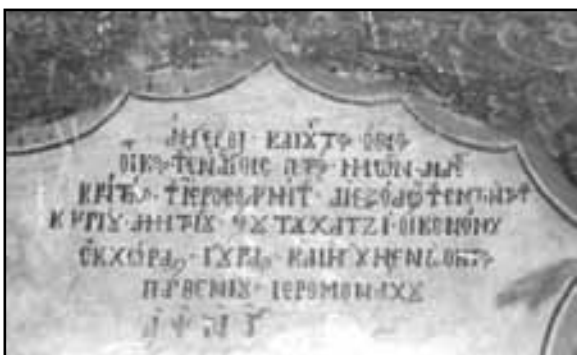
Εικ. 11. Η κτητορική επιγραφή πάνω από την είσοδο του Παρεκκλησίου Αγίου Ανδρέα Κρήτης του Καθολικού Ι.Μ. Γεωργίου Στυλίδας.

Το παρεκκλήσιο είναι προσαρτημένο στη βορειοδυτική πλευρά του ναού με είσοδο από το νάρθηκα. Είναι μονόκλιτος σταυροειδής εγγεγραμμένος ναός με τρούλλο όμοιο και ανάλογο, αλλά λίγο μικρότερο, από τον κεντρικό τρούλλο. (26) Στο ορθογώνιο της κάτοψης προσκολλάται η κόγχη του Ιερού Βήματος με ένα κεραμοσκεπασμένο τεταρτοσφαίριο στο επάνω μέρος και είναι ημικυλινδρική εσωτερικώς και εξωτερικώς. Και εδώ οι κόγχες της Προθέσεως και του Διακονικού εγγράφονται στο πάχος του ανατολικού τοίχου. Το παρεκκλήσιο είναι δομημένο με διαφορετική πέτρα. Φαίνεται ότι κτίσθηκε μετά από τον ναό, που είναι δομημένος, εξωτερικώς, με πω-