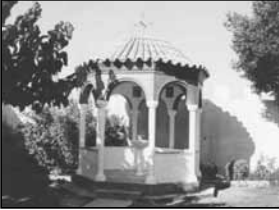
Εικ.9. Η φιάλη στα δυτικά του καθολικού, όπου γίνονται οι πανηγυρικές τελετές της Μονής και ο αγιασμός.

που πήρε πλέον τη μορφή βυζαντινού κάστρου, (Εικ.10), οι φωτισμένοι χώροι εντός και εκτός του περιβόλου και ιδιαίτερα ο ναός αποτέλεσαν και αποτελούν παράδειγμα τάξης και ευπρόεπειας. (21)