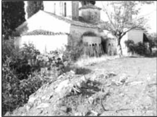
Εικ. 5.Το καθολικό της Ι.Μονής Αγίου Γεωργίου Στυλίδας όπως το βρήκαν οι πατέρες της Μονής το 1883. Εργασίες διαμόρφωσης του περιβάλλοντα χώρου.

Ο ναός του Αγίου Γεωργίου, (Εικ.5) απογυμνωμένος, και παρ' ότι είχε καταστήσει στάβλος ζώων, άντεξε στη φθορά και διατηρήθηκαν, σχεδόν ανέπαφες, οι τοιχογραφίες του. (11)