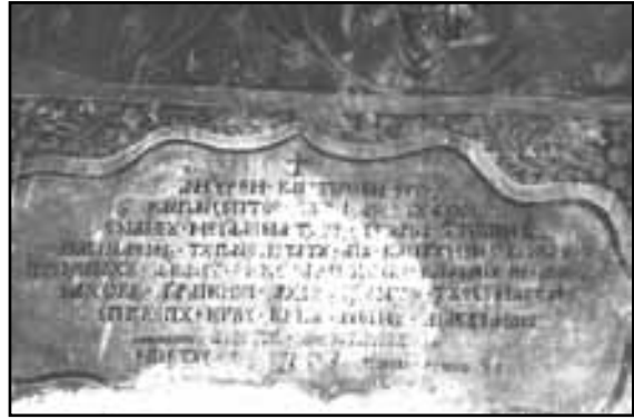
Εικ. 3. Η κτητορική επιγραφή πάνω από την είσοδο στον κυρίως ναό.

Κατά τα μετεπαναστατικά χρόνια λειτούργησε, ως κυρίαρχο μοναστήρι, μέχρι το έτος 1834. Κατά το έτος αυτό και με την εφαρμογή του οθωνικού διατάγματος του 1833 (25 Σεπτεμβρίου 1833) το Μοναστήρι διαλύθηκε, τυπικά, και σταμάτησε τη λειτουργία του αφού δεν διέθετε τους απαιτούμενους έξι μοναχούς. (7)