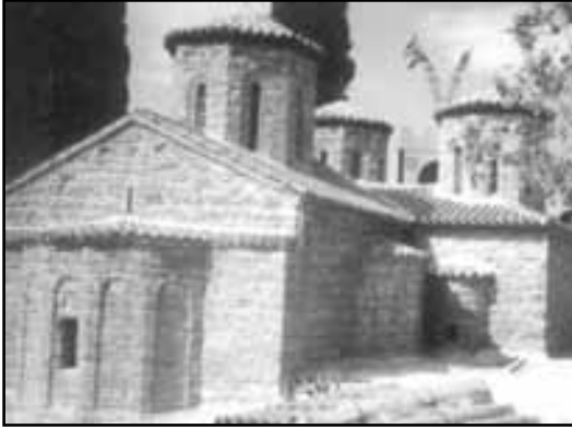
Εικ.8. Το Καθολικό της Ι.Μ. Αγίου Γεωργίου όπως αποκαταστάθηκε το 1995.