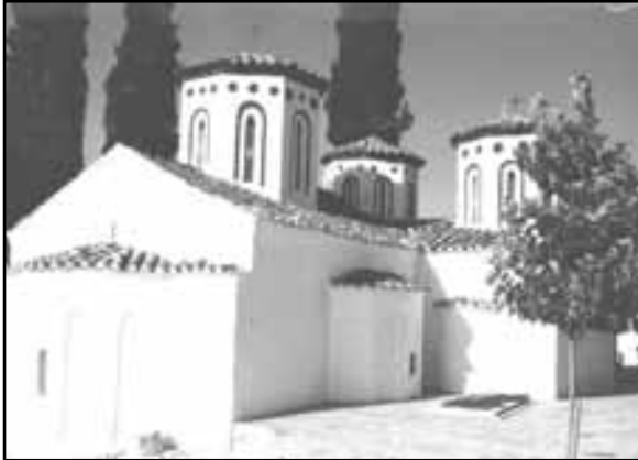
Εικ.6. Ένας πρώτος ευπρεπισμός του Καθολικού και του περιβάλλοντα χώρου.