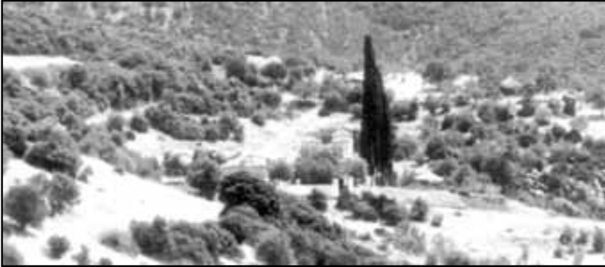
Εικ.2. Το Μοναστήρι του Αγίου Γεωργίου ένα χρόνο μετά την εγκατάσταση της μοναστικής αδελφότητας με Ηγούμενο τον π. Ιγνάτιο.

Παρακαμπτήριος βατός χωματόδρομος, δύο χιλιομέτρων, συνδέει το Μοναστήρι του Αγίου Γεωργίου με τον ασφαλτοστρωμένο δρόμο Στυλίδας - Νεράιδας.