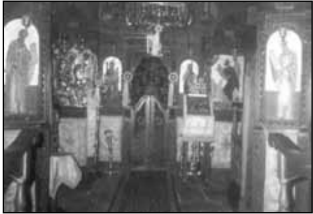
Εικ.7.Το ανανεωμένο εσωτερικό του κυρίως ναού με το νεότευκτο ξυλόγλυπτο τέμπλο και τον υπόλοιπο ιερό διάκοσμο.

το Ιερό Βήμα και η Αγία Τράπεζα, έγινε προμήθεια ιερών σκευών και λειτουργικών βιβλίων, τοποθετήθηκε εικονοστάσι με τις προβλεπόμενες εικόνες, μπήκε στη θέση της η εφέστια εικόνα του Αγίου Γεωργίου, τοποθετήθηκαν αναλόγια, στασίδια και δυο προσκυνητάρια και το εσωτερικό του ναού πήρε την απαραίτητη όψη του χώρου λατρείας. (14) (Εικ.7). Και όλα αυτά έγιναν με την ακλόνητη πίστη, την ισχυρή θέληση, τον ακάματο ζήλο, την ανεξήγητη εργατικότητα και τον καθημερινό μόχθο των πατέρων της Μονής, πέραν των επώδυνων μοναχικών τους καθηκόντων, και με τη συνδρομή και βοήθεια των απλών ανθρώπων της γύρω περιοχής. Έτσι διασώθηκε το μνημείο! (15)(16)(17)