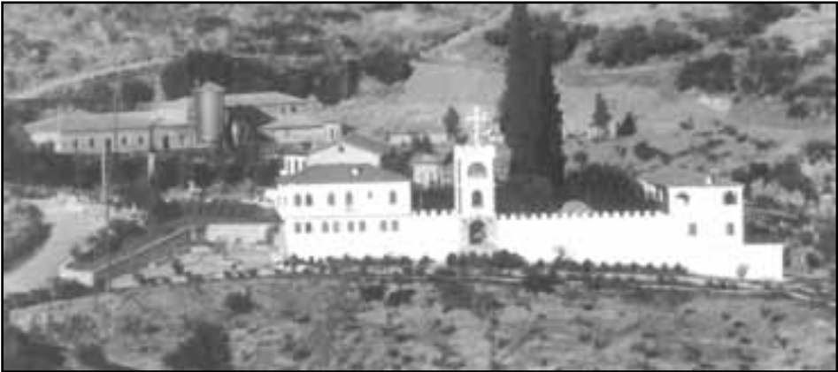
Εικ. 10. Το Μοναστήρι του Αγίου Γεωργίου στη σημερινή του μορφή.

Να σημειώσουμε και πάλι πως η συνδρομή και η βοήθεια των ανώνυμων και των επώνυμων χριστιανών, των φίλων της Μονής και των Υπηρεσιών του Νομού Φθιώτιδας και των εκτός αυτού, υπήρξε σημαντική. (22)