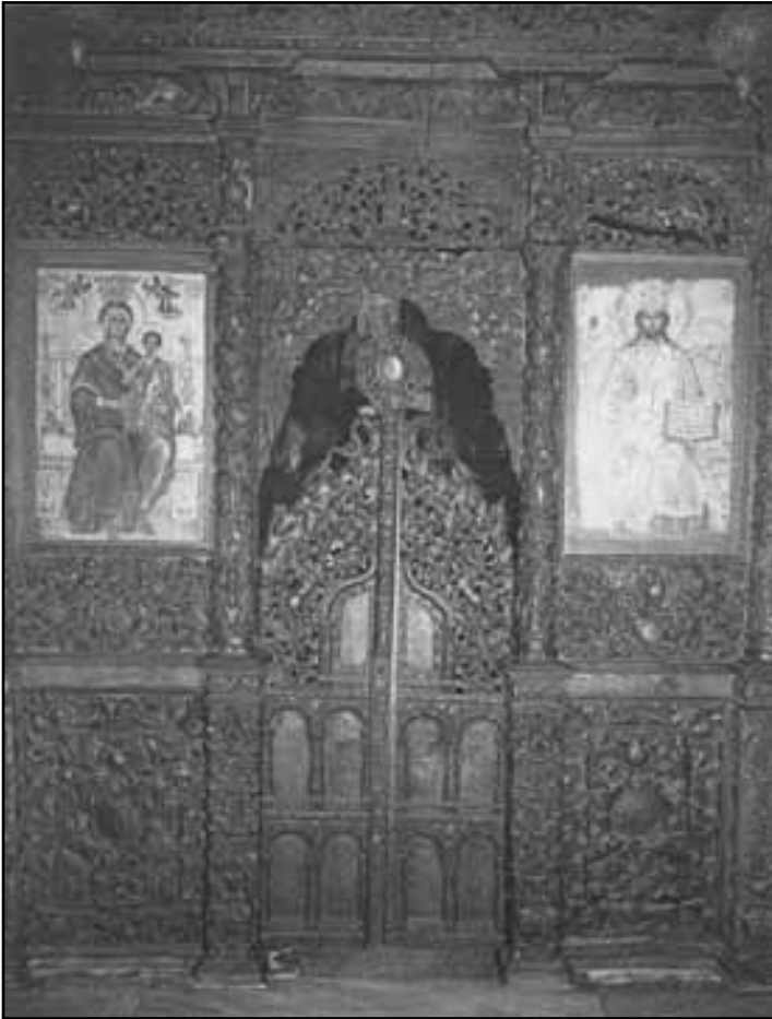
Εικ. 4. Το παλαιό ξυλόγλυπτο τέμπλο της Ιεράς Μονής Αγίου Γεωργίου Στυλίδος, που κοσμεί σήμερα το Καθολικό της Ιεράς Μονής Αγάθωνος.

κειμήλια, τα ιερά σκεύη, τα λειτουργικά βιβλία, τα λείψανα αγίων, οι εικόνες και η εφέστια εικόνα του Αγίου Γεωργίου μεταφέρθηκαν, προς φύλαξη, σε γειτονικά μοναστήρια. (9) Το ξυλόγλυπτο εικονοστάσι (Εικ.4), (τέμπλο),