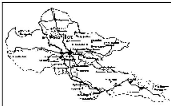
Εικ.1. Χάρτης με τα Μοναστήρια του νομού Φθιώτιδας.

Ένα από τα πολλά Μοναστήρια της Φθιώτιδας είναι και η Ιερά Μονή Αγίου Γεωργίου Στυλίδας. (1) Το Μοναστήρι αυτό στέκεται σκαρφαλωμένο στις νότιες υπώρειες της Όθρυος ανάμεσα στα χωριά Νεράιδα και Άνυδρο. (Εικ.2) Απέχει 26 χιλιόμετρα από τη Λαμία και βρίσκεται 10 χιλιόμετρα, βορειοανατολικά, της Στυλίδας. (2)