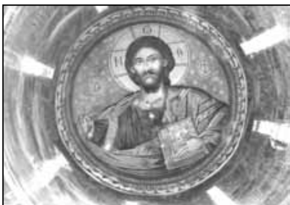
Εικ.12. Ο Παντοκράτορας στο Παρεκκλήσιο του Αγίου Ανδρέα Κρήτης της Ιεράς Μονής Αγίου Γεωργίου Στυλίδας.