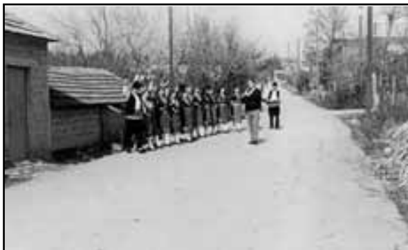
Από το έθιμο της Ρουμπάνας.

Το Σάββατο του Λαζάρου πρωί - πρωί ξεκινούσε η μικρή Ρουμπάνα. Μικρές ομάδες κοριτσιών (2 - 3) επισκέπτονται τα σπίτια και τραγουδούν τραγούδια αφιερωμένα στο Λάζαρο. Λίγο αργότερα ξεκινούν μεγάλες κοπέλες σε δυο ομάδες για να επισκεφτούν όλα τα