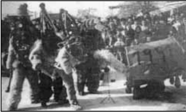
Κωμική σκηνή από το Πρωτοχρονιάτικο έθιμο «καμήλες και ντιβιτζήδες» στο Ν. Μοναστήρι Φθιώτιδας.

χέρι της Παναγίας, με διάφορα γεωργικά εργαλεία και γεωργικά προϊόντα. Ο νοικοκύρης του σπιτιού, αφού θα θυμιάτσει το τραπέζι ασπάζεται το χέρι της Παναγίας. Αφού ασπασθούν και τα υπόλοιπα μέλη της οικογένειας το χέρι της Παναγίας ο νοικοκύρης θα τοποθετήσει το ονώψωμο στο κεφάλι του και μπροστά στο εικόνισμα του σπιτιού θα σπάσει το ονώψωμο στα τέσσερα. Το κομμάτι που είναι στολισμένο με το χέρι της Παναγίας αφιερώνεται στη Θεοτόκο που έφερε στον κόσμο το νεογέννητο Χριστό. Η βασιλόπιτα (τυρόπιτα ή λαχανόπιτα) θα μπει στο τραπέζι μετά το φαγητό. Ο νοικοκύρης κόβει σε κομμάτια τη βασιλόπιτα ανάλογα με τα μέλη της οικογένειας. Αφού στρώσει τρεις φορές σαν οβούρα το ταψί που περιέχει τη βασιλόπιτα, ο