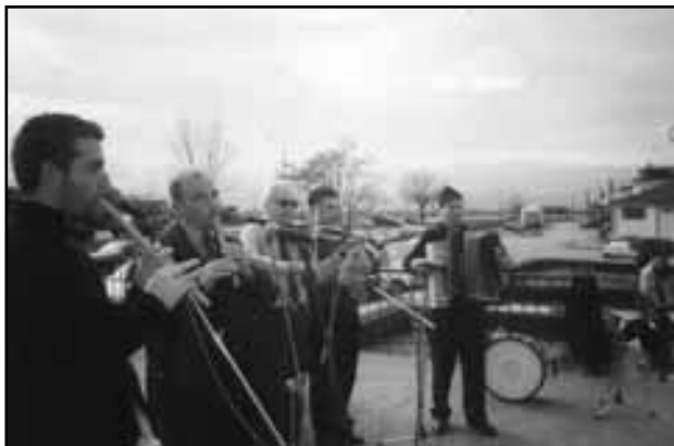
Ντόπιοι μουσικοί οργανοπαίχτες με Νεομοναστηριώτικα ηχοχρώματα στηρίζουν τα έθιμά τους.

Από τις αρχές της δεκαετίας του '70 ο αριθμός των παραδοσιακών οργανοπαικτών άρχισε να μειώνεται. Ο θάνατος του τελευταίου γκαϊντατζή του Γιώργου Στογιαννούδη γνωστού ως Ζανιά ενεργοποίησε την τοπική κοινωνία και το 1996 δημιούργησε ένα πυρήνα 20 νέων για εκμάθηση της Μοναστηριώτικης μουσικής με παραδοσιακά όργανα.