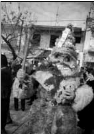
Χαρακτηριστική παρουσία Ντιβιτζή. (Καμηλιέρη)

χέρι της Παναγίας, με διάφορα γεωργικά εργαλεία και γεωργικά προϊόντα. Ο νοικοκύρης του σπιτιού, αφού θα θυμιάτσει το τραπέζι ασπάζεται το χέρι της Παναγίας. Αφού ασπασθούν και τα υπόλοιπα μέλη της οικογένειας το χέρι της Παναγίας ο νοικοκύρης θα τοποθετήσει το ονώψωμο στο κεφάλι του και μπροστά στο εικόνισμα του σπιτιού θα σπάσει το ονώψωμο στα τέσσερα. Το κομμάτι που είναι στολισμένο με το χέρι της Παναγίας αφιερώνεται στη Θεοτόκο που έφερε στον κόσμο το νεογέννητο Χριστό. Η βασιλόπιτα (τυρόπιτα ή λαχανόπιτα) θα μπει στο τραπέζι μετά το φαγητό. Ο νοικοκύρης κόβει σε κομμάτια τη βασιλόπιτα ανάλογα με τα μέλη της οικογένειας. Αφού στρώσει τρεις φορές σαν οβούρα το ταψί που περιέχει τη βασιλόπιτα, ο