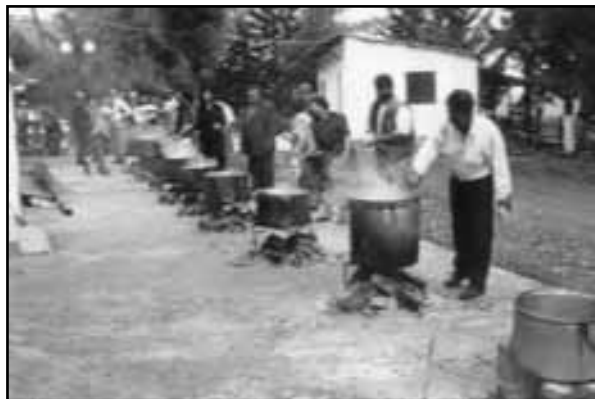
Νεομοναστηριώτες βράζουν το κρέας και το μπλιγούρι σε καζάνια στο Κουρμπάνι της Αναλήψεως. (φωτ.αρχείο: Ηρακλή Κυροδήμου).

Το Κουρμπάνι είναι ένα έθιμο που έφεραν οι Νεομοναστηριώτες από την Ανατολική Ρωμυλία, την αλύτρωτη Ορφική γη. Από το 1925 που ακούμπησαν και ριζώσαν στη Φθιωτική γη κάθε χρόνο αναβιώνουν και γιορτάζουν το Κουρμπάνι μέχρι και σήμερα. Εκτός από την περίοδο της δικτατορίας.