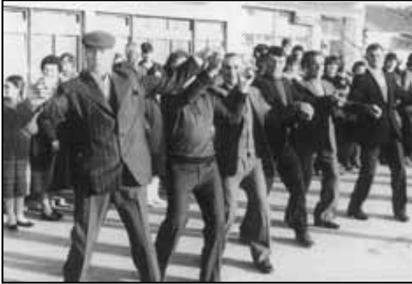
Ζωναράδικος χορός που κυριαρχεί σε όλες τις περιστάσεις. (φωτ.αρχείο: Δημητρίου Ιτούδη).

κάνουν πολλές φιγούρες και χρησιμοποιούν την ονομασία «Τσέστο» (μικρά σβέλτα βήματα). Όταν τον χορεύουν μόνο άντρες οι φιγούρες είναι τέτοιες που κάνουν το χορό συναρπαστικό. Γίνεται ακόμη και ένας ευγενής ανταγωνισμός (χορευτικές κόντρες). Κάθε ομάδα χορεύοντας αντικριστά προσπαθεί να επιδείξει (καταθέσει) το