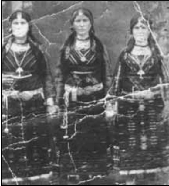
Αναμνηστική φωτογραφία μετά το έθιμο της Περπιρούνας. (φωτ.αρχείο: Στέργιου Πατσαλίδη).